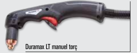
Duramax LT manuel torç