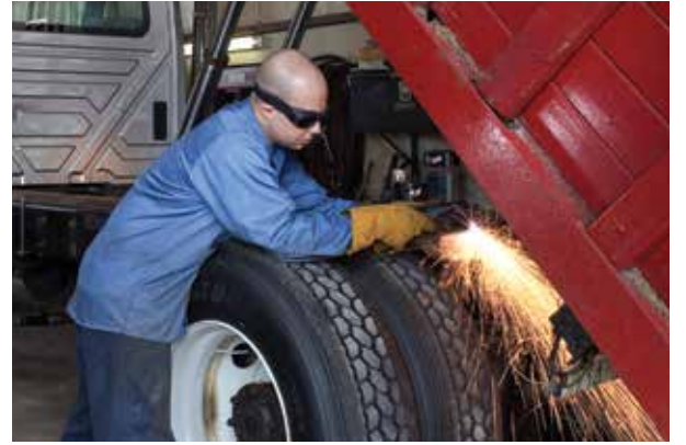
Taşıt tamirati ve modifikasyonu